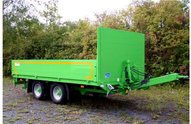
Ges.-Gew. 6900 kg , BestellNr. 751/6900, NL ca. 5100 kg, Lademaß ca. 4460x2430 mm, Ladehöhe unbeladen ca. 850 mm, Zubehör: Lackierte Alu-Bordwände 60 cm hoch, Stirnwanderhöhung aus Aluminium Bordwänden mit Verstärkung