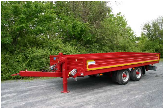
Ges.-Gew. 8900 kg , BestellNr. 752/8900, NL ca. 6950 kg, Lademaß ca. 4940x2430 mm, Ladehöhe unbeladen ca. 870 mm,