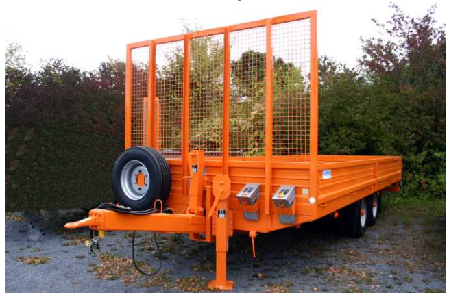
Ges.-Gew. 10500 kg , BestellNr. 754/10500, NL ca. 8200 kg, Lademaß ca. 4940x2430 mm, Ladehöhe unbeladen ca. 900 mm, Zubehör: Stirnwanderhöhung aus Welldraht