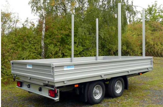
Ges.-Gew. 5000 kg , BestellNr. 745/5000, NL ca. 3500 kg, Lademaß ca. 4000x2300 mm, Ladehöhe unbeladen ca. 780 mm, Zubehör: ohne hintere Eckpfosten, Rungen im Boden steckbar