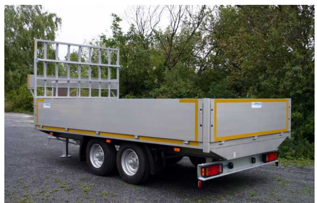
Ges.-Gew. 14000 kg , BestellNr. 756/14000, NL ca. 11500 kg, Lademaß ca. 4940x2430 mm, Ladehöhe unbeladen ca. 1100 mm, Zubehör: Alu-Bordwände 60 cm hoch, spezielle Stirnwanderhöhung