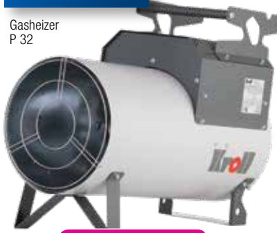
Gasheizer P 32